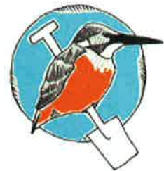
IJsvogelwerkgroep Gooi en Vechtstreek