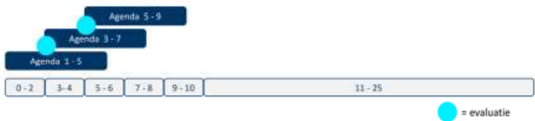
Figuur 1: De voortschrijdende agenda in beeld

We voorzien een langere periode van circulaire transitie in onze regio. Wat we in die periode allemaal gaan of moeten doen en wanneer is nu nog niet precies bekend, veel is nog ongewis en ontwikkelingen gaan snel. Om die reden hebben we gekozen voor een voortschrijdende agenda. In deze agenda kijken en plannen we steeds 2 jaar vooruit en evalueren we elke jaar. Vervolgens stellen we onze agenda op basis van de evaluatie bij en voegen we twee jaren toe.