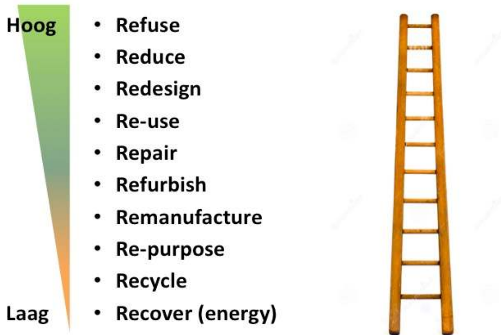
Fig 2. De ladder van Cramer

hergebruik van onderdelen (en materialen) en als laatste hergebruik van grondstoffen. Preventie staat bovenaan, verbranden van grondstoffen onderaan. Indien dit economisch niet haalbaar blijkt wordt opgeschaald naar een grotere schaal of wordt gekozen voor een laagwaardiger verwerking. Lokaal wat kan, bovenregionaal wat moet. Het creëren van maatschappelijke meerwaarde is hierbij een factor van betekenis.