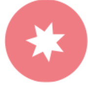
Cultuur aan de basis