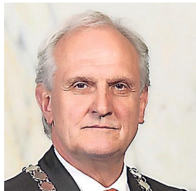
Broertjes: lobbyist regio broodnodig

Op de tweede plaats gaat de organisatie van de Regio op de schop. Het algemeen bestuur (de burgemeesters) gaat over de bedrijfsvoering, maar de portefeuillehouders (wet-