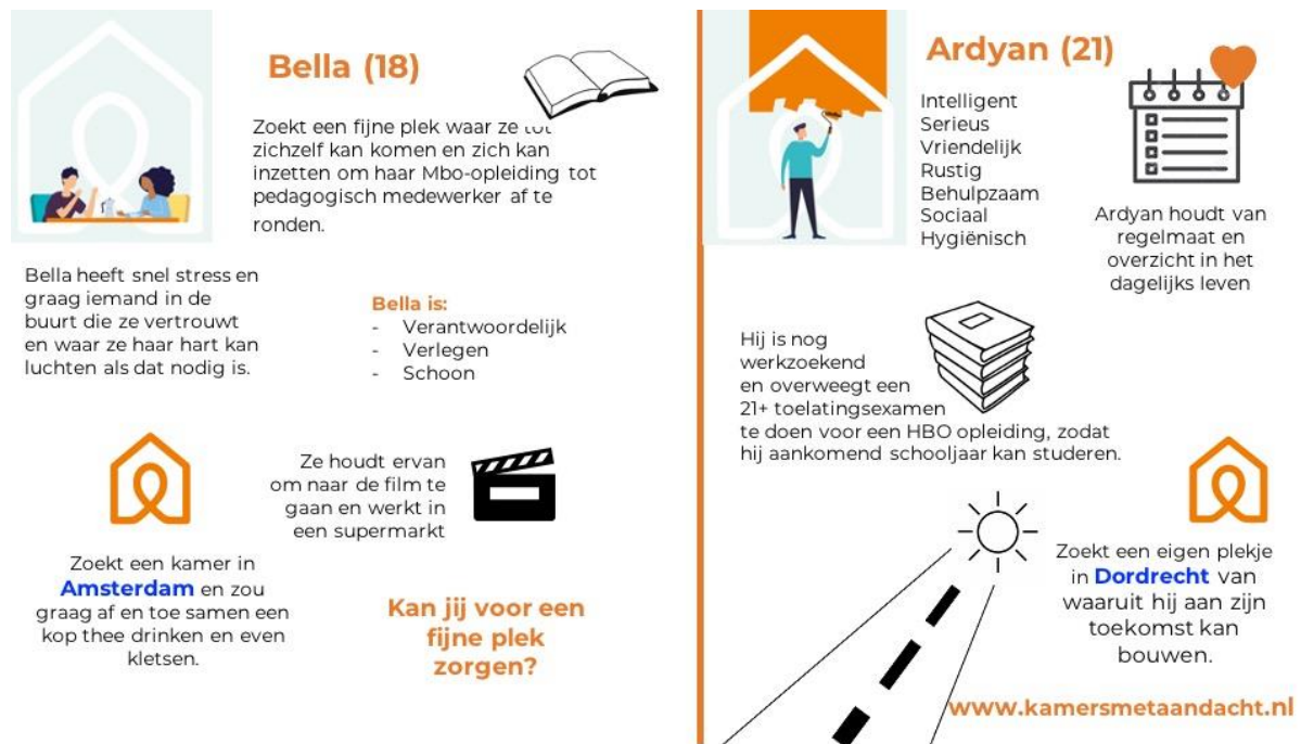
Figuur 2: Jongeren op zoek naar een kamer met aandacht

KmA screent en bemiddelt ook kamers in niet deelnemende (rand)gemeenten. Jongeren die bereid zijn om de regio te verlaten, kunnen op de website de openstaande kamers bekijken. Wanneer er sprake is van een inhoudelijke match, dan organiseert KmA de kennismaking en ondersteuning. Daarnaast is het voor jongeren die een Kamer met Aandacht zoeken ook mogelijk om zichzelf voor te stellen op onze website. KmA wil hiermee potentiële verhuurders enthousiasmeren en een bijdrage leveren aan een positievere beeldvorming van ex-jeugdzorg en/of dakloze jongeren binnen onze maatschappij.