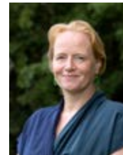
Rosan Kocken, regiogedeputeerde Gooi en Vechtstreek